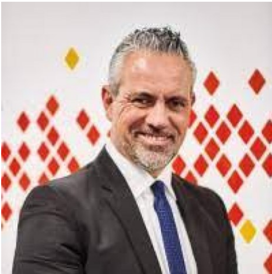
Il program di Program

Il bouquet di proposte per la flotta non finisce qui: localizzazione del veicolo, monitoraggio dei chilometri, archiviazione dei percorsi effettivi, verifica da remoto dei consumi e rifornimenti, “geofence”, l’alert per il FM se il veicolo entra in una zona ritenute a rischio. A nostro avviso però quest’ultima funzione è discutibile e può avere degli effetti negativi sul driver, che ne sia o meno consapevole.