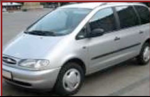
Valore Autoveicolo: € 29.500