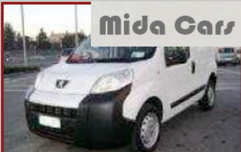
Valore Autoveicolo: € 13.000

La Ford Galaxy è stata portata via mentre si trovava parcheggiata in una strada pubblica sotto l'abitazione del proprietario forzando la serratura della portiera e manomettendo la centralina. Dopo la conferma del furto, è stata attivata l'unità LoJack installata al suo interno per consentire alle pattuglie delle Forze di Polizia dotate di Vehicle Tracing Computer LoJack (VTC) di ricevere il segnale in Radio Frequenza e recuperare l'auto. La Ford Galaxy è stata ritrovata da una pattuglia della Polizia Stradale mentre si trovava chiusa e parcheggiata in un'ampia area di sosta pubblica della frazione Giardinetti di Roma. Il recupero è avvenuto dopo solo un'ora e trenta minuti dalla segnalazione del furto e la tempestività delle operazioni di recupero ha consentito di ritrovare l'auto in perfette condizioni , tali da velocizzare anche le pratiche di riconsegna al legittimo proprietario senza recare alcuno stravolgimento nella sua routine.