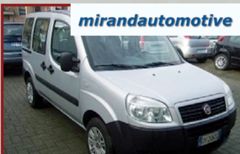
Valore Autoveicolo: € 16.200