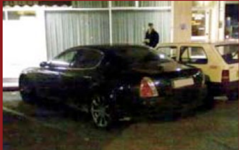
Valore Autoveicolo: € 116.550

Luogo: Sant'Ilario D'Enza (RE), 19 febbraio 2011