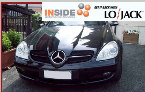
Valore Autoveicolo: € 40.000

Grazie alla segnalazione tempestiva del proprietario, una pattuglia delle Forze dell'Ordine si è subito messa sulle tracce del Bipper seguendone gli spostamenti attraverso il segnale in Radio Frequenza emesso dall'unità LoJack installata al suo interno. Il recupero è avvenuto dopo poche ore in una strada pubblica di Caivano dove il Bipper si trovava parcheggiato e regolarmente chiuso. Il proprietario ha potuto così tirare un sospiro di sollievo per il felice epilogo di una brutta storia di furto grazie all'efficacia del sistema LoJack.