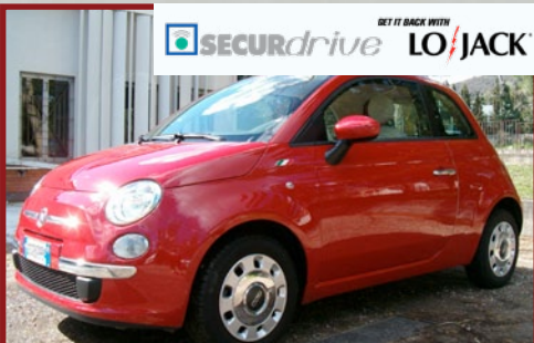
Valore Autoveicolo: € 14.500

La società di noleggio spagnola, dopo la mancata consegna dell'auto entro i termini previsti e dopo essere venuta a conoscenza dell'ulteriore "sub noleggio" della Maserati, ha denunciato il furto della vettura il 18 febbraio avvisando nel contempo la sede LoJack spagnola per attivare il Sistema di Recupero LoJack. Trattandosi di una supercar e a fronte di una probabile appropriazione indebita della vettura, la sede spagnola LoJack ha attivato il Network di Recupero Europeo per il recupero della Maserati. Fortunatamente il segnale in Radiofrequenza non si è fatto attendere ed è stato captato in Italia, nei pressi di Reggio Emilia. Grazie al segnale emesso dal sensore LoJack nascosto all'interno della Maserati è stato possibile seguire gli spostamenti dell'auto sino a Sant'Ilario d'Enza (RE), dove la Maserati è stata ritrovata parcheggiata di fronte ad un hotel. Sono state due pattuglie dei Carabinieri ad intervenire sul posto prelevando, nel cuore della notte, il malvivente che era stato visto alla guida della Maserati in compagnia della donna rumena mentre dormivano in una stanza dell'hotel. La sfortunata coppia è stata accompagnata in Caserma e dopo aver verificato le loro generalità, sono stati entrambi denunciati per ricettazione.