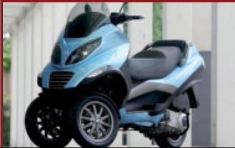
Valore Motoveicolo: € 6,200