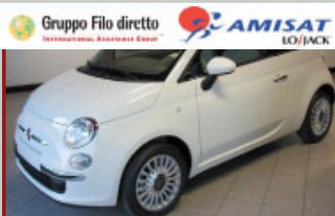
Totale Valore Autoveicoli: € 65,380

A Sarno (Salerno) una pattuglia del Commissariato ritrova una Alfa 147 nascosta in un box grazie al sistema LoJack per rintracciare e recuperare veicoli rubati. L'auto era stata rubata a Fiumicino, sotto l'abitazione del proprietario, dove era stata parcheggiata poche ore prima. Fondamentali sono state la tecnologia wireless ad Alta Frequenza del sistema LoJack, che ha consentito di rilevare il segnale anche all'interno del box, ed il sistema LoJack Early Warning ad avviso immediato per consentire di agire tempestivamente ed impedire eventuali danni sul veicolo. Il proprietario ha così potuto riavere il suo veicolo in poco tempo, soddisfatto di aver affidato la protezione del suo veicolo nelle mani di esperti nella lotta contro il furto.