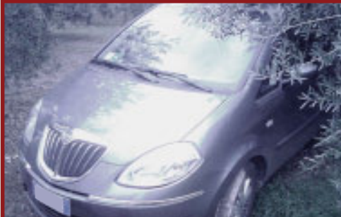
Valore Autoveicolo: € 15,600