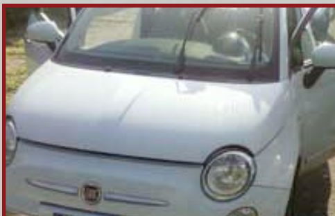
Valore Autoveicolo: € 11,000

*Tempo stimato dalla prima rilevazione del segnale radio.