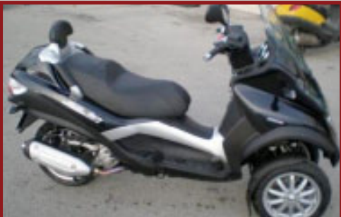
Valore Motoveicolo: € 6,200

Il sistema wireless ad Alta Frequenza LoJack, l'innovativa tecnologia per rintracciare e recuperare i veicoli rubati, ha consentito alle Forze dell'Ordine di ritrovare un veicolo rubato in sole 8 ore. E' successo ad Andria mercoledì 16 settembre, il veicolo, una Lancia Musa equipaggiata con il sistema LoJack è stato rubato alle ore 8.45 mentre si trovava in strada regolarmente parcheggiato. I Carabinieri di Andria grazie al sistema LoJack l'hanno ritrovato alle ore 17.00, in una masseria distante 5 km dalla strada, nascosto tra gli ulivi; l'auto è stata messa temporaneamente sotto sequestro e ulteriori indagini sono in corso.