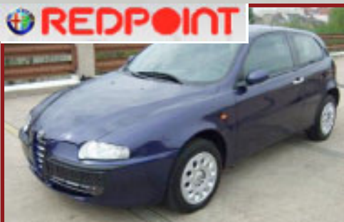
Valore Autoveicolo: € 20,000

Il ladro, approfittando di una distrazione del proprietario, era riuscito a rubare il motoveicolo e a far perdere le sue tracce, ma il sistema LoJack veniva prontamente attivato e dopo solo due ore dalla denuncia del furto la Polizia Locale di Milano ritrovava lo scooter regolarmente parcheggiato lungo la carreggiata di una via del quartiere Dergano. Il proprietario del motoveicolo ha mostrato tutta la sua gratitudine per il recupero lampo ringraziando il Team LoJack e dichiarando di prestare più attenzione d'ora in avanti.