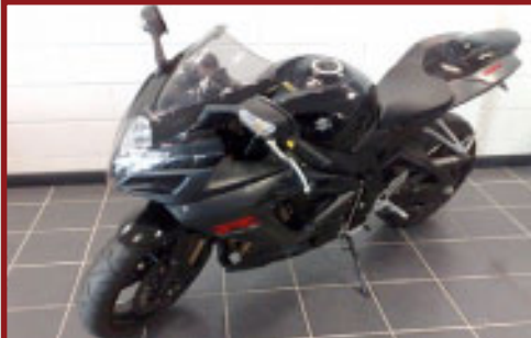
Valore Motoveicolo: € 10,400