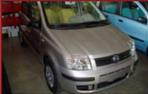
Totale Valore Autoveicoli: € 65,450