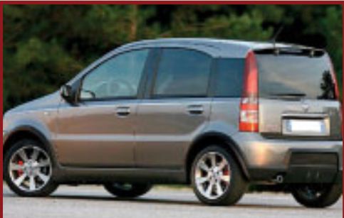
Valore Autoveicolo: € 14,000

La Polizia, seguendo il segnale del sistema LoJack, ha recuperato una Suzuki GSX 600 sottratta al suo proprietario, parcheggiata sotto la sua abitazione a Roma. Doppio brutto colpo per i ladri per i quali è andato in fumo il lavoro di una notte. La durata totale dell'operazione è stata di circa 10 ore, conclusa da una pattuglia della Polizia Stradale della sottosezione di Settebagni con il recupero della moto all'interno di un furgone Nissan Vanette Cargo parcheggiato in via Magnetite il quale, a seguito di ulteriori accertamenti, risultava rubato in data 8 maggio.