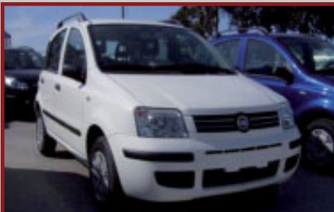
Valore Autoveicolo: € 14,000

Lunedì 4 Maggio, dopo un week end trascorso fuori casa, il proprietario della Fiat Panda si accorgeva che l'auto non si trovava più nel punto in cui l'aveva parcheggiata prima della sua partenza. Si recava così presso la Questura di Salerno dove alle ore 10.10 sporgeva denuncia. Immediatamente la centrale operativa LoJack provvedeva ad attivare l'unità all'interno del veicolo che veniva rintracciato in una via di Boscoreale, dove una pattuglia dei Carabinieri di Torre Annunziata, alle ore 13.45 lo trovava regolarmente parcheggiato, ma aperto e con un catenaccio al volante.