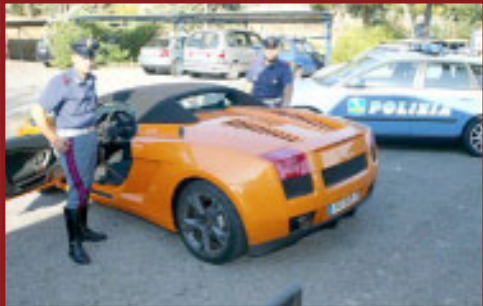
Valore Autoveicolo: € 170,000