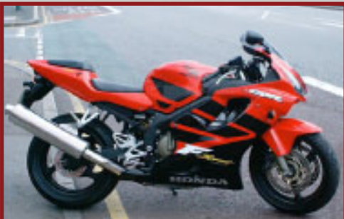
Valore Motoveicolo: € 9,000

La Polizia Stradale ha messo fine alla corsa di una Lamborghini Gallardo Orange in direzione Napoli con il fermo delle 2 persone a bordo. La macchina era stata rubata a seguito di una rapina in una casa di Potenza Picena dopo aver narcotizzato gli inquilini. Dopo la notifica di furto da parte dei nostri colleghi durante la mattina del 26 luglio, il segnale è stato intercettato in Italia la sera stessa, alle 20:50, prima nei pressi di Ancona e successivamente in movimento verso Roma. La sua corsa si è conclusa al Km 578 dell'A1 grazie ad una pattuglia della Stradale Roma nord.