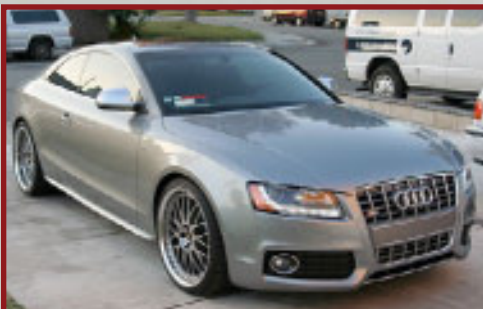
Valore Autoveicolo: € 59,400

*Tempo stimato dall'intercezione del segnale da parte dell'elicottero.