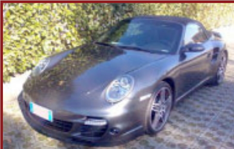
Valore Autoveicolo: € 140,000

Il sistema wireless ad Alta Frequenza LoJack, l'innovativa tecnologia per rintracciare e recuperare i veicoli rubati, ha consentito alle Forze dell'Ordine di scoprire il nascondiglio di una banda criminale a Parete (CE). All'interno di un garage le Forze dell'Ordine hanno potuto ritrovare 4 vetture rubate: una Fiat Panda, una Fiat Idea, una Fiat Punto e una Lancia Delta. L'operazione aveva avuto il via con il furto di una Fiat Panda, che era equipaggiata con il sistema LoJack, il 12 ottobre. L'auto era stata rubata mentre era parcheggiata in Via de Crecchio a Napoli. Alle ore 17.05 il dispositivo LoJack all'interno della Panda veniva attivato e solo 7 ore dopo, alle 00.10 del 13 ottobre l'auto veniva rilevata all'interno di un garage di un complesso residenziale a Parete. Allertata, la Guardia di Finanza faceva irruzione nel box, ritrovando la Panda e le altre auto.